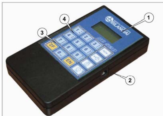
Abbildung ... - Fernsteuerung